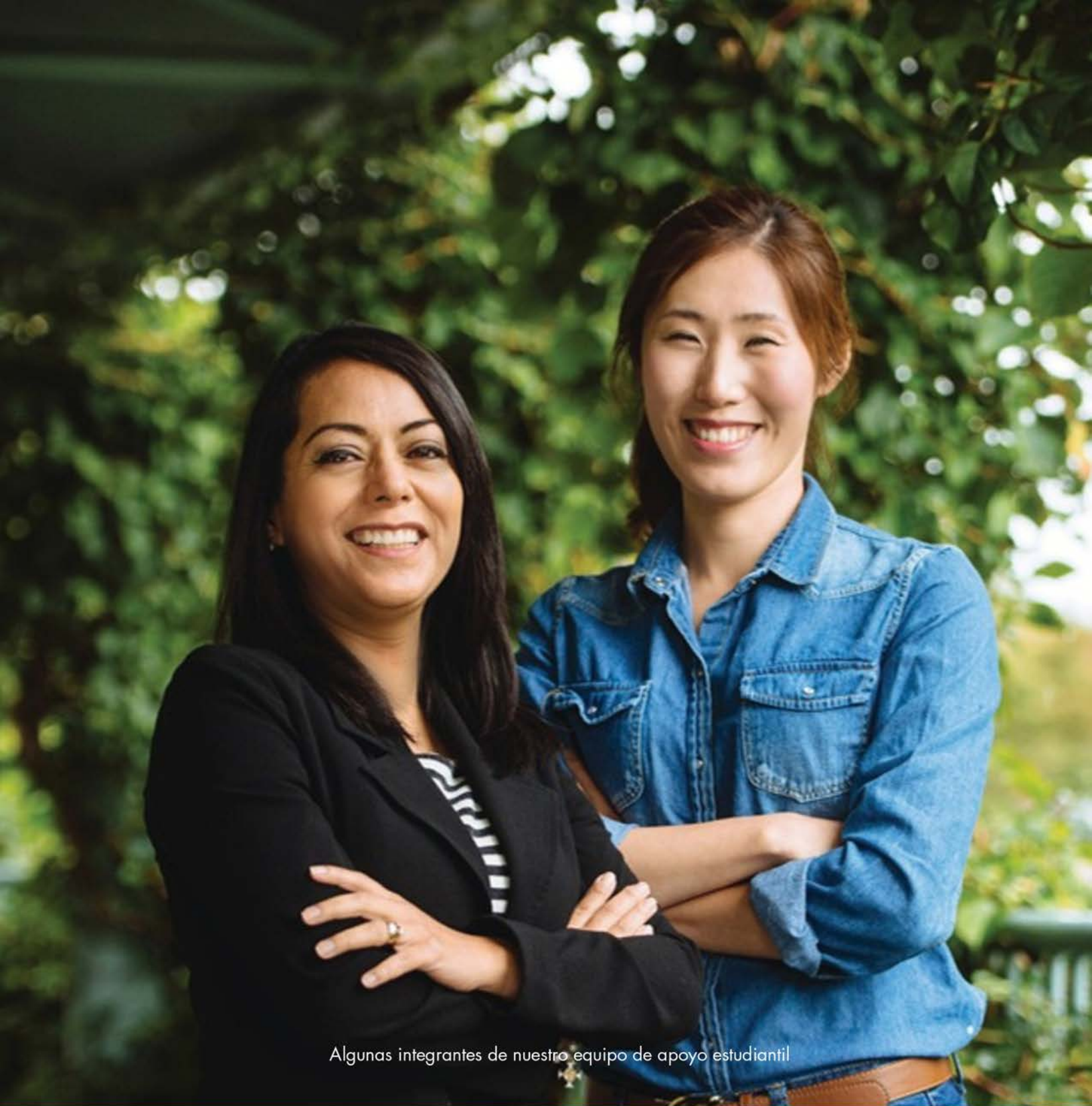
Algunas integrantes de nuestro equipo de apoyo estudiantil